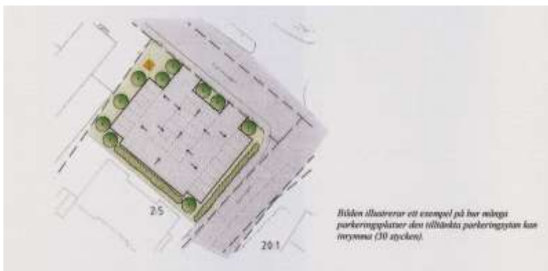
Bilder ur detaljplansförslaget för tomten Libbarbo 2:5, där IOGT stod.

Isabelle undrar hur många som tycker det är bäst med parkering på hälften av tomten respektive hela. Efter handuppräkning verkar det finnas mycket tveksamheter om vad som är bäst, hälften svarar inte och av den andra hälften som svarar är det ungefär lika många som svarar olika (med någon fler röst på alternativet hela tomten).